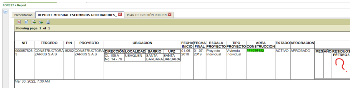
Imagen 5. Ausencia de cargue de soportes de disposición final y aprovechamiento. PIN 15202.